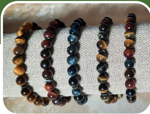
Oeil de tigre

BIJOUX TALISMAN POUR HOMME pour activer votre Masculin Divin