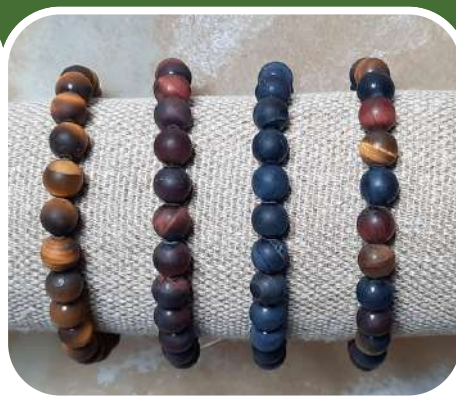
Oeil de tigre version mate